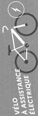
VÉLO À ASSISTANCE ÉLECTRIQUE

VÉLO CARGO, VÉLO ALLONGÉ, VÉLO ADAPTÉ À UNE SITUATION DE HANDICAP, VÉLO PLIANT (ÉLECTRIQUE)